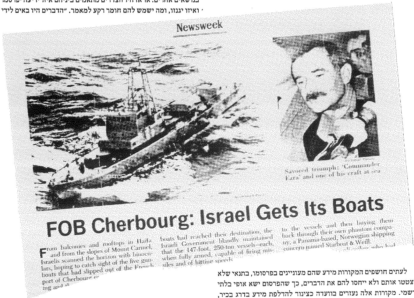
"הברחת ספינות שרבורג – הכותרת שלה "ניוויק". בארץ נתבקשה ועדת העורכים ל"דממה תקשורתית" בעניין זה

יתקבל הרושם שהם נכתבו לפי בקשה מגבוה. לעומת זאת כונסה הוועדה כדי לתבוע מהעורכים "דממה פובליציסטית", כשהוברחו ספינות הטילים משרבורג, או כשנמסר על קבלתם של מטוסי ה"פאנטום" הראשונים בספטמבר 1969. בקשות כגון אלה אינן מחייבות, ורצונם הטוב של העורכים חשוב לעניין זה, פי כמה יותר משהוא חשוב בעת קבלתו של מידע סודי.