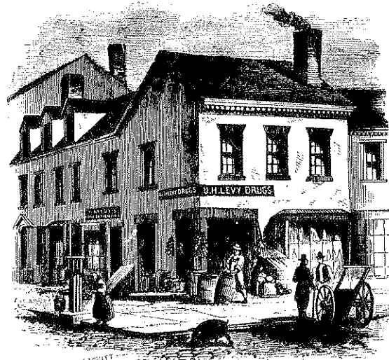
בית עסק יהודי בניו יורק בתקופה שבו הופיע ה"דה ג'ר" — ה"דראג סטור" של ו.ה. לוי

כרעם ביום כהיר הונפה על היהודים האמונים על חופש הפולחן הדתי חרב השמד. מבחינה מנטלית או פסיכולוגית מדובר בציבור יהודי ספרדי-פורטוגזי בעל "תסמונת האנוסים", ציבור