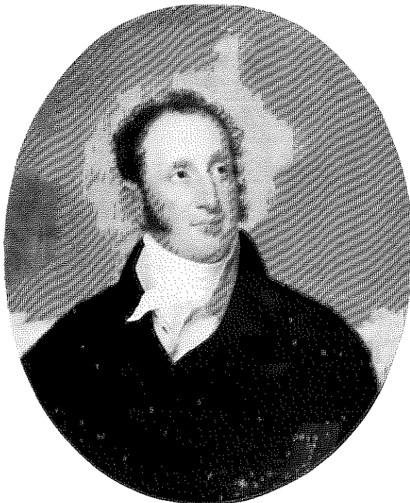
מרדכי עמנואל נוח — "דובר היהודים" באמריקה בתחילת המאה ה-19

מציאות מרה זו שטפחה על פני היהודים באה לידי ביטוי בפרשת חייו הפוליטית של מרדכי עמנואל נוח (Noah) (1785-1851). הוא הוגדר כ"דוברם של היהודים" והוזמן לאירועים ציבוריים כנציג היהודים. בקריירה הפוליטית שלו בניו יורק התוודע נוח אל האנטישמיות. הוא היה דמות יוצאת דופן: פעיל ב"שארית ישראל", פוליטיקאי בולט, עתונאי שערך את ה-"National Advocate", דיפלומט שסבל מאנטישמיות, הוגה דעות ומחזאי. כרוב יהודי ארצות הברית היה בעל קשרים עם היהדות האירופית וכמותם הטיף לשינויים באופי היהודי ובפרט תמך בעקרון הפרודוקטיביזציה.