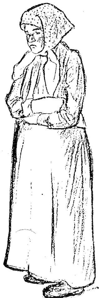
דמויות נשים יהודיות בניו יורק בשלהי המאה ה-19, באיוריו של יעקב אפשטיין. בכיוון השעון: אשה יהודיה, ילדה מרחוב הסטר, צעירה בפנים רציניות, גיטל, סטודנטית שהגיעה מרוסיה, טיפוס "רוסי"