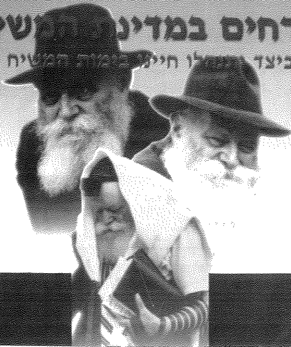
כיצד יתנהלו חיינו בימות המשיח? את התשובה מספק הפירסום הזה, בהוצאת בית חב"ד בראשון לציון

שכוחם הפוליטי-חב"תי של הדתיים בכלל ושל חב"ד בפרט מתחזק וככל שישנה התקדמות משמעותית בתהליך השלום, כך ההתבטאויות נעשות חדות וברורות, כדי שלא יהיה ספק בלב איש מהו סדר העדיפויות של ציבור זה.