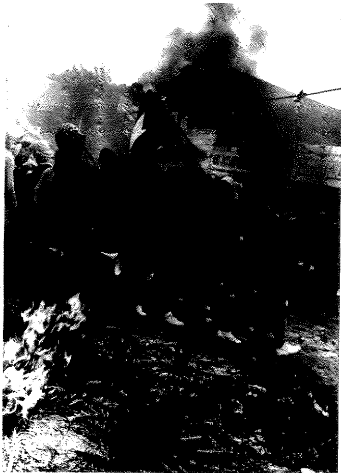
מראה מן האינתיפאדה - אוניברסיטת ביר זית, ינואר 1988

השפעת האינתיפאדה על אזרחי מדינת ישראל הערבים הייתה מיידית וכבר ב-21 בדצמבר 1987 הכריזו על שביתה כללית. ההיענות לשביתה הייתה מלאה, אך ערביי ישראל לא הסתפקו בעצרות והשבתה אלא אימצו את הדגם האלים של המתאה. לפי רכס, גרמה ההתקוממות בשטחים לעליית תלולה - "בת מאות אחוזים" - במספר ביטויי הלאומנות של ערביי ישראל - לעומת התקופה שקדמה