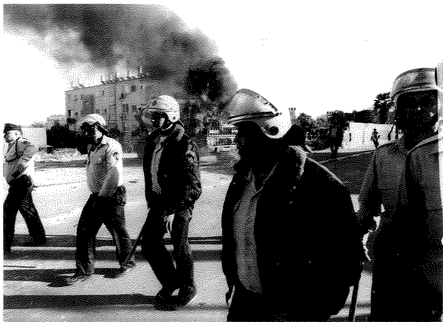
האם יפו בוערת? בעקבות הפגנות והתפרעויות של ערביי יפו, לאחר הטבח במערכת המכפלה בתחילת 1994 (תקופה מאוחרת יותר מזו המתוארת במאמר)