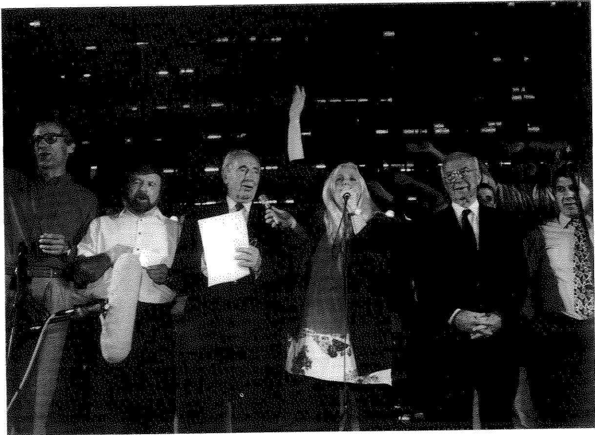
התצלום האחרון. יצחק רבין ליד הזמרת מירי אלוני השרה את "שיר לשלום". לאחר דקות אחדות - נורה רבין