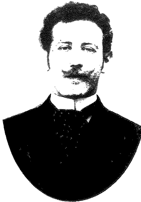
אלפרד קר הצעיר - תצלום מ-1898

ארבע שנים כיו"ר מועדון P.E.N. הגרמני בלונדון. עם תום מלחמת העולם השנייה שב קר לגרמניה, וכתב עבור היומנים "די ולט" (Die Welt) ו"די נויק" צייטונג" (Die neue Zeitung). הוא מת בהמבורג ב-12 באוקטובר 1948.