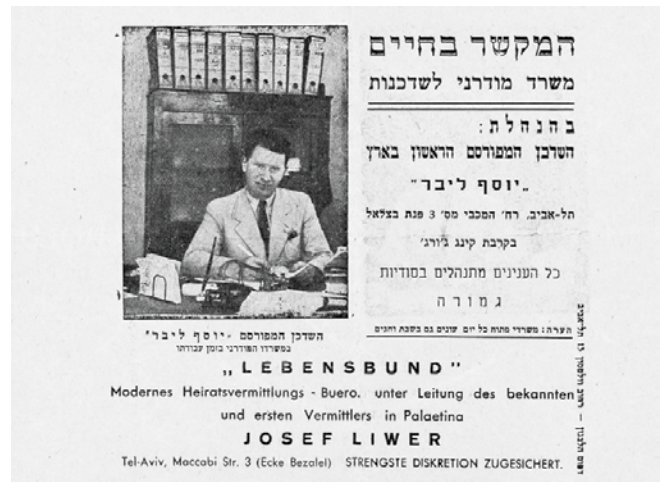
מתוך השדכן המודרני: מודריך מודרני לנישואין בארץ, תל-אביב 1938

את הבית לשלושה וחצי חדרים בגלל העומס. כל חדר שנוסף התמלא בצעירים שחיפשו בני זוג, ובערב היו בבית אנשים בכל מקום: בבית עצמו, בחצר, ברחוב, בחדר אחד ישבו גברים ובחדר אחר הנשים, וברוניה אצה רצה מחדר לחדר. במקביל היו יוסף ומשה לוקחים את בני הזוג המיועדים ומפגישים ביניהם ברחובות קרובים ומשאירים אותם שם. כל הערב היו רצים שלושת השדכנים בין בני זוג פוטנציאליים, ושאר בני המשפחה העבירו את הזמן בחוץ. 57 שעה לפני חצות, לאחר שיצאו אחרוני הלוקוחות, היה המשרד מתרוקן והופך שוב לבית. בחצות היה