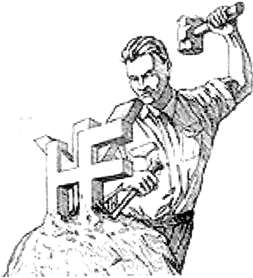
סמל אתר האינטרנט הגזעני The Heritage Front מדבר בעד עצמו