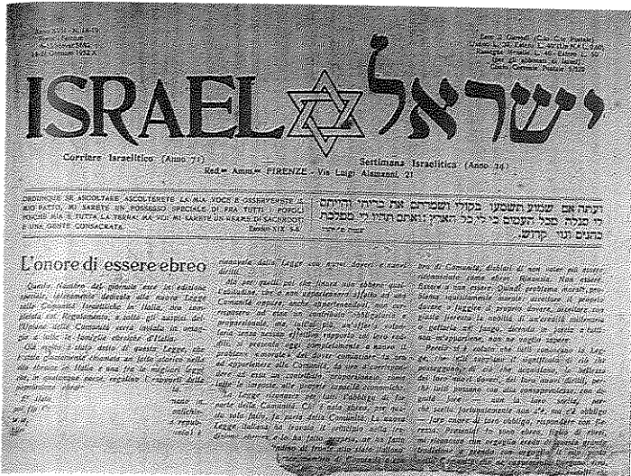
ישראל האיטלקי, הרבה לפני קום מדינת ישראל

Nostra Bandiera (הדגל שלנו). עתון זה, שהיה ההפך הגמור מישראל, תמך לחלוטין במשטר, אבל הגיב לאנטישמיות של כמה עתונים פשיסטים (דוגמת Il Tevere של טלזיו אינטרלנדי [Interlandi]) והתנגד, במידת האפשר, לברית בין איטליה לגרמניה. La Nostra Bandiera רצה במולדת אחת ויחידה - איטליה - והתנגד לציונות, אך מתוך סתירה מסוימת התעניין בארץ ישראל ורחש אהדה רעיונית לימין הציוני של ז'בוטינסקי. 21