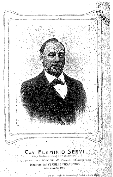
מלאמיניו סרבי ועתונו - הדגל היהודי

Israelitico (הדגל היהודי). 9 היה זה עידן של תופעות מנוגדות: מצד אחד השתלבו היהודים בחברה האירופית, ומן הצד האחר האשימו אותם חוגים ועיתונים מסוימים בהשפעה גדולה מדי, בקשרים בין לאומיים ובקשרים עם ארגוני הבונים החופשיים, בהשתייכות לאומה אחרת ולגזע אחר. למילה "גזע", שהופצה על-ידי התרבות הפוזיטיביסטית, לא היתה תמיד משמעות עוינת של שוני יסודי, אלא משמעות של אומה, ויהודים רבים השתמשו בה כדי להגדיר את עצמם. כך שמרו מקצת מהיהודים על זהותם כעם או כאומה, ואילו אחרים הגדירו את עצמם רק - או בעיקר - לפי הדת: הם היו איטלקים בני הדת היהודית.