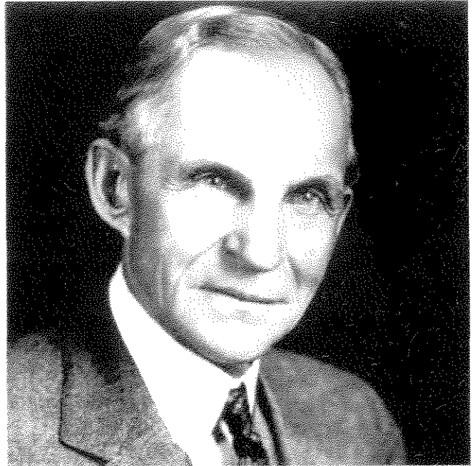
הנרי פורד, אבי תעשיית המכוניות פורד