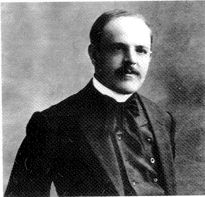
ביאליק בתקופת מלחמת העולם הראשונה

מגורש ממנו. אפילו שירותו של הבן בצבא אינו מקנה למשפחה זכויות יתר. בן זה, אחיו של המספר המשרת כמחצצר בצבא הצאר, יגורש ביום פקודה מהכפר עם כל בני משפחתו, כאילו לא תרם דבר ל"מולדת". הסיפור מהווה בבואה למבוכה של "על פרשת דרכים", ומעורר מחשבות היסטוריוסופיות על התלקחותה המחודשת בכל דור של תופעת האנטישמיות, המביאה על העם גזרות וגירושים, נישול ומיתות משונות.