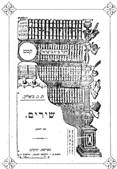
ספר השירים הראשון, 1902

בביתו כלב, הן מתוך יראה והן מתוך חשש טומאה). מכאן שהתקרבות היהודי לאורחות חיייהם של הגויים לא הצילה אותה מגורלו הנצחי של היהודי - "שעיר לעזאזל" וקרבת תמיד; מטרה לחציה המורעלים של שנאת ישראל. הרי לנו מימוש מקברי ואכזרי מאין כמוהו לביטוי "מות כלבים", היפוכו של המושג "מות ישרים", שבו הרבה ביאליק להשתמש לציון