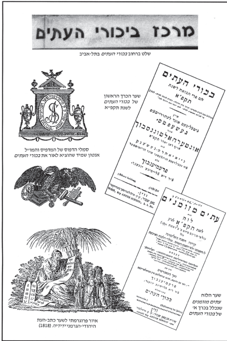
מתוך: בכורי העתים – בכורי ההשכלה, הוצאת מאגנס

אשר הוציאו לאור את ספרי ההשכלה וספרי הקודש והסופרים המגיהים שהוזמנו לעבוד בהם. מקור נוסף למשכילים שנטו למתינות בענייני דת ולהידבקות במורשת התרבות העברית לדורותיה היו יהודים שהיגרו מפולין ונתגלגלו לממלכה האוסטרו-הונגרית ועברו בטלוליהם מגליציה לוונייה. הללו למדו בנערותם, היו מעורים במקורות היהדות, והייתה להם זיקה חיובית למורשת ישראל בנוסח ההשכלה העברית המתונה. 19 אלה ואף סוחרים יהודים מרחבי האימפריה – מבוהמיה, מוראביה,