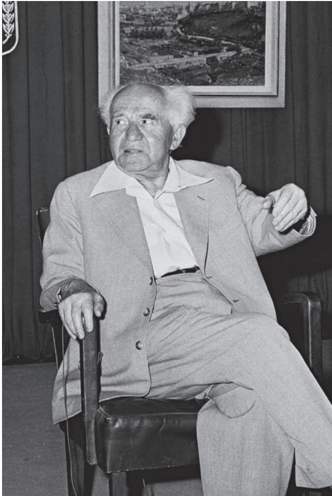
דוד בן-גוריון – מהמתנגדים להכנסת טלוויזיה לישראל

אז הוראתה ללא הבדל אם הם לומדים בירושלים או בדימונה, או מבוגרים היושבים בלכיש, בחבל ערד או בישובי הספר ובאמצעות מכשירי הטלוויזיה אפשר יהיה לקרובם למרכזי התרבות שלנו. זהו הנימוק המרכזי והקובע, אצלי על כל פנים. וכל יתר הנימוקים המופיעים לבקרים בעיתונות הינם נימוקי לוואי שיכולים להוסיף (ולעיתים לגרוע) ממשקלו של הנימוק המרכזי 19 .