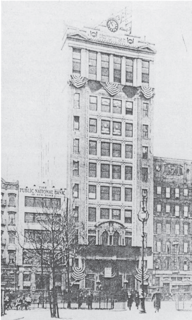
בניין מערכת הפארווערטס בניו יורק

תפוצה יומית של כמה אלפי עותקים, הנה הלכה זו וגדלה באופן קבוע: 44,600 בשנת 1906; 72,300 ב־1907; 83,400 ב־1909; 113,800 שנה לאחר מכן; מעל ל־130,000 במרוצת 1911; וממוצע של קרוב ל־140,000 עותקים ליום לאורך שנת הבחירות לנשיאות של שנת 1912 26 . עוצמה מסחרית זו אפשרה לאנשי 'איגוד הפארווערטס' [בעליו של העיתון דה יורה], להגשים חלום אותו רקם אייב קאהאן [העורך הראשי והאדם המרכזי בפארווערטס דה פקטו] כבר ב־1907: להקים עבור העיתון בניין בן 10 קומות שיעמוד במרכז 'הרובע היהודי' בדרום־מזרח העיר התחתית [Lower east side]. ב־1912 נחנך הבניין ברוב טקס 27 .