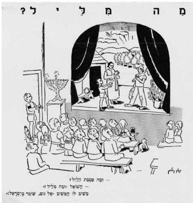
דבר לילדים, 12.11.1936 (מוזיאון נחום גוטמן לאמנות, נווה-צדק, תל אביב)