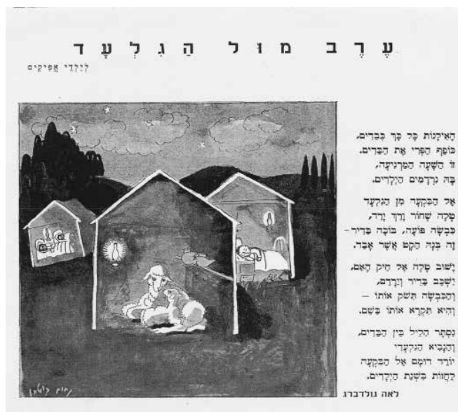
דבר לילדים, 20.1.1938 (מוזיאון נחום גוטמן לאמנות, נווה צדק, תל אביב)

ברוק היה אדם פשוט, אלמוני, שבתנועת הקיבוץ המאוחד נהגו להתרפק על "הטיפוס האידיאלי" של החלוץ המגשים הניבט ממנו, 46 אבל בכל זאת קשה היה לחצוב מדמותו ומפועלו עד רציחתו את מלוא המרכיבים הנדרשים לעיצוב "גיבור" שאפשר בנקל להזדהות עמו. את המענה לצורך ב"גיבור" העניקו שניים: ראשית, קיבוץ חניתה. ב"מכתב מחניתה" ששלח י' נודד (יצחק שדה, מפקד הפו"ש) לבתו הוא היטיב לתמצת את גבורת התקופה ואת סתירותיה – יישוב הספר המלווה בריקודים ובצלמים שמנציחים את החוגגים ששרים יחד עם המסירות בחפירת עמדות ההגנה סביב האוהלים ואומץ הלב שגילו הנאחזים בהר לנוכח התקפת הירי הערבית לעת לילה. ה"גיבור" היה כאן המפעל החלוצי ונקודת היישוב הממשית בפאתי השממה הארצישראלית. 47 שנית, אלכסנדר זייד. הריגתו סמוך לביתו בשייח' אבריק ב־11 ביולי 1938 סיפקה את המאויים המודחקים לדמות