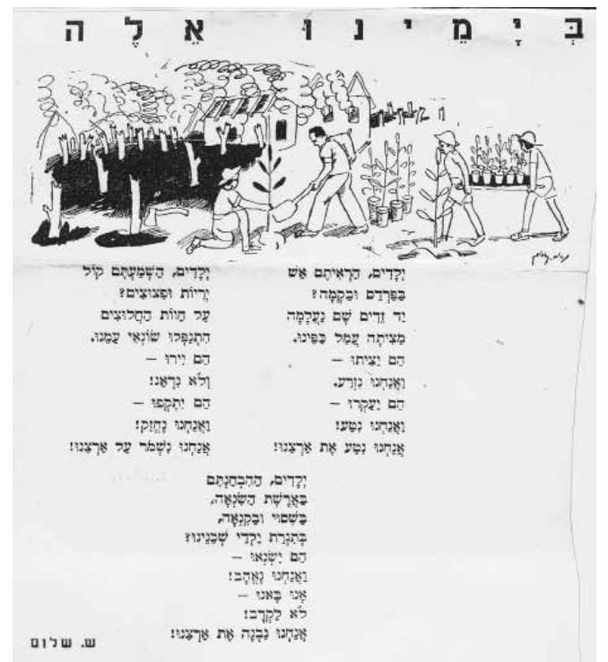
דבר לילדים, 21.5.1936

בה בעת ראוי לזכור כי ככלות הכול היה זה עיתון לילדים, שלא עסק גם בימים של תקריות דמים רק בדיני נפשות המצויים ברומו של עולם המבוגרים. עורכיו ידעו שעל מנת למלא את תפקידם נאמנה חיוני כי יקצו מקום גם לסוגיות פרוזאיות יותר לכאורה, אשר מנקודת מבטם של הילדים לא נפלו בדרגת חשיבותן בעיצוב עולמם, אך גם מילאו תפקיד בהכשרת דור המשתתף באופן פעיל וכפי יכולתו במאבק הלאומי. כזה היה לבטח השיקול שהנחה את פרסומו של מכתב למערכת שחיבר תלמיד כיתה ד' בשכונת ברוכוב שבגבעתיים, ובו סיפר כי ראה ילד