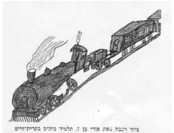
דבר לילדים, 26.1.1939