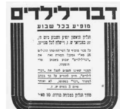
דבר, פברואר 1936

לימים קצין החינוך הראשי של צה"ל. שם השיר היה "בעין חרוד", והוא נפתח במילים המופלאות והטעונות: "בעין חרוד טוב מאוד, אין שם כסף כלל". פיאורן של ההתיישבות העובדת, של ההסתפקות במועט המכילה בו בזמן את המרובה ושל העדפת צורכי הכלל על הנאות הפרט עתידים היו להיות שלושה מן המוטיבים הבולטים בחומר שהתפרסם מעל דפי דבר לילדים בשני העשורים הבאים. 4