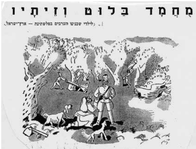
דבר לילדים, 29.10.1936 (מוזיאון נחום גוטמן לאמנות, נווה צדק, תל אביב)

בעין חרוד ידעו לדווח בינואר 1937 לילדי העיר קרילוב שבפולין, כי "לא כל הערבים הם רוצחים כפי שאתם משערים. יש לנו ידידים רבים בין הערבים, אנשים אצילים ויפי נפש. [...] מקווים אנו, כי הערבים סוף-סוף יבינו לרוחנו ויחדלו משנאתם אלינו." 37