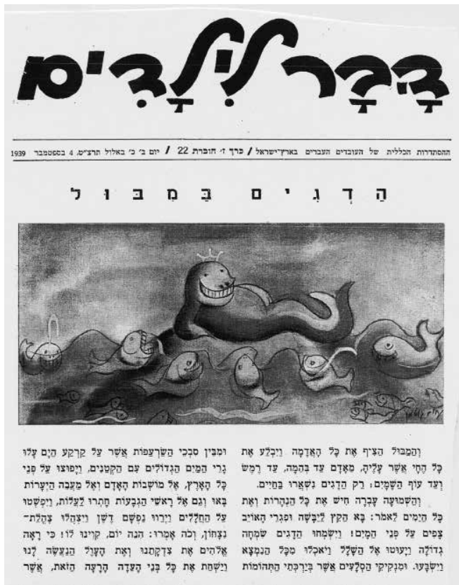
(מוזיאון נחום גוטמן לאמנות, נווה צדק, תל אביב)

לא רק המתרחש בפולין ובגרמניה העסיק את קוראי דבר לילדים. הם נחשפו גם אל המתרחש בחלקי עולם אחרים, אם כי באופן נינוח יותר. אחד המדורים הפופולריים ביותר בדבר לילדים נקרא "הידעת?". המדור סיפק את תאוות סקרנותם של הילדים באמצעות קוריוזים ואנקדוטות שעסקו באירועים יוצאי דופן ברחבי תבל. כך, למשל, במדור שפורסם ב-22 ביוני 1939 הובא לידיעת הילדים המידע הבא: ממשלת יפן מעודדת את אוכלוסיית המדינה לחזור ולהשתמש בנעלי עץ במקום בנעלי עור יקרות בגלל הצורך להוריד את רמת החיים עקב מימון המלחמה נגד סין; בזכות התפתחות התחבורה האווירית מתקצר