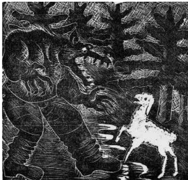
דבר לילדים, 14.5.1936

ההכרה ש"אין עם מי לדבר" וכי ה"שלום" הוא בגדר מחוז כיסופים שבו דוגל היהודי, אך שאין בו חפץ מהעבר השני של המתרס, הייתה במהרה למסר מקובל בדבר לילדים. הוא הסתמך על הדעה המקובלת בקרב שלושה מבכירי מעצבי ההשקפות הרעיוניות בסוגיות הללו במפא"י – ברל כצנלסון, יצחק טבנקין ומשה ביילינסון 26 – שנחשבו ברי סמכא לחלק נכבד מן הכותבים בדבר לילדים, והשקפתם בנדון הונחלה בעיבוד המותאם לגיל הקוראים באמצעות מאמרי מערכת, שירים, כתבות, אירוים וכותרות. אף אם נפליג ונניח כי המסר הזה היה כל כולו פועל יוצא מן החתירה לשקף את המציאות באופן מהימן, הרי שלעיתים נדמה כי הוא הוטמע והוטבע בתודעת קוראיו הצעירים של העיתון כסוג של תופעת טבע נתונה שבמסגרתה הוצא האויב שמנגד אל מחוץ לתחומי המין האנושי. לשיאם הגיעו הדברים בשירו של ש' שלום, "בימינו אלה" שבו תבע/קרא/תהה/פסק: "יְלָדִים, הַהֲבִיחֶם